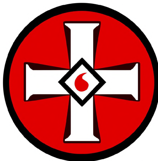
Рисунок 1. Эмблема ультраправой организации «Ку-клукс-клан»