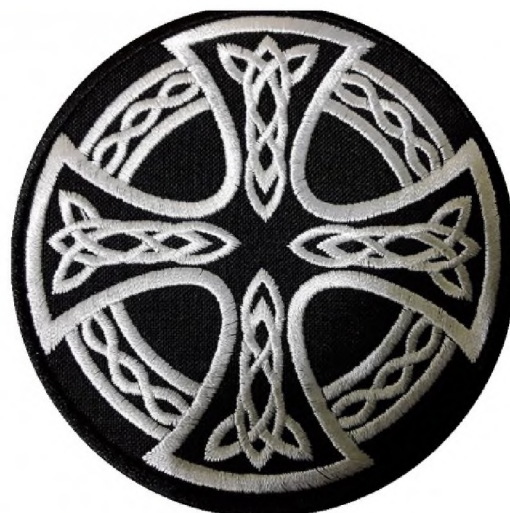
Рисунок 2. Кельтский крест. Символ многих расистских организаций